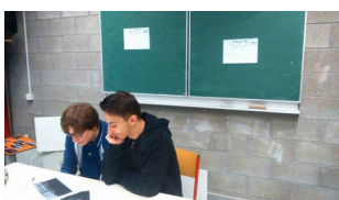
Elle se nourrit de ce qui a été vu et entendu