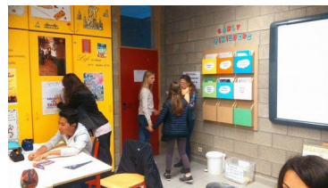
Le mieux n'est-il pas d'aller voir sur place? Conciliabule (in English)