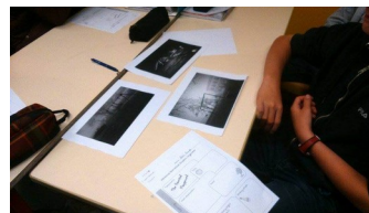
L'histoire prend forme